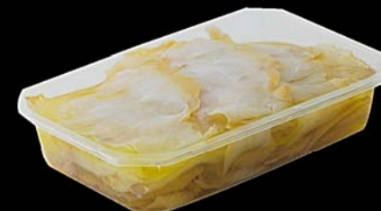
▶ Bacalao ahumado en aceite de oliva