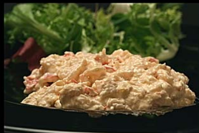
◀ Ensalada de embutido alemán