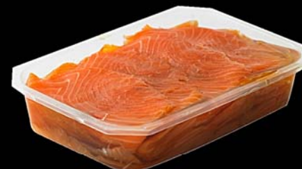
▶ Salmón ahumado en aceite