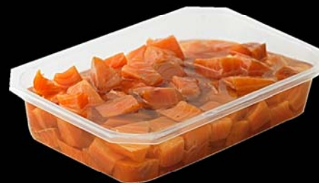
◀ Lomo de Salmón ahumado en aceite cortado en dados