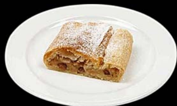
Hojaldre de manzana Apfelstrudel