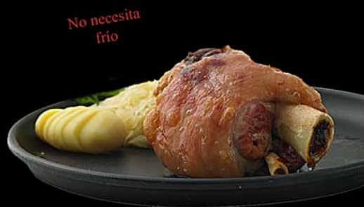
1/2 Codillo de la Baviera Peso neto: 250 gr.