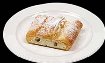
Hojaldre de queso Topfenstrudel