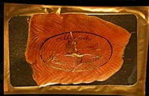
▶ Salmón ahumado Sobres de 500 gr.