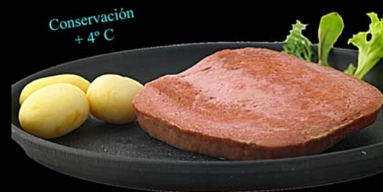
◀ Pastel de carne Fleischkäse Peso neto: 1,3 kg.