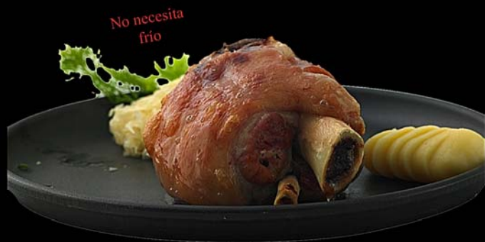
Codillo de la Baviera Peso neto: 500 gr.