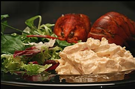
◀ Ensalada de bogavante