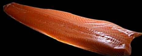
▶ Salmón ahumado precortado.