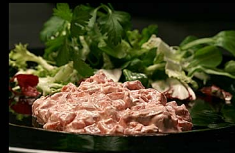
◀ Ensalada de gulas