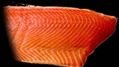
◀ Trucha ahumada Piezas de 1,1 a 1,4 kg Fileteado o entero