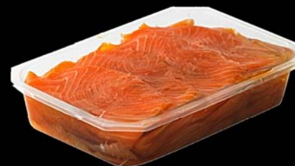
◀ Trucha ahumada en aceite