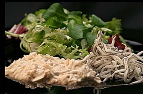
Ensalada de gambas ▶