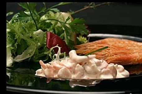
◀ Ensalada de Centollo