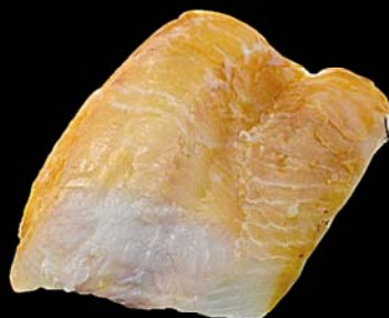
▶ Bacalao ahumado Piezas de 0,9 a 1,4 kg Fileteado o entero