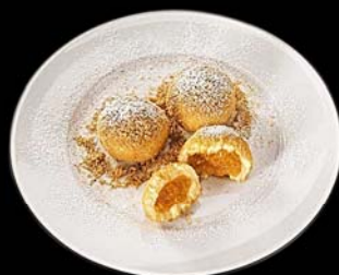
Bolitas de albaricoque Marillenknödel