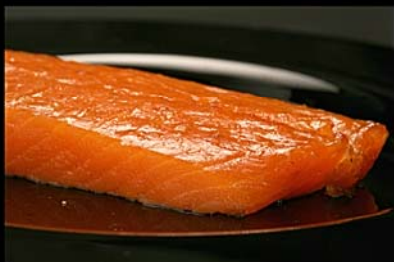
◀ Lomo de Salmón ahumado Piezas de 800 gr. Fileteado o entero