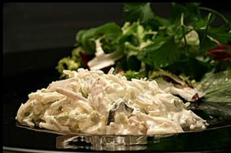
◀ Ensalada de salmón ahumado