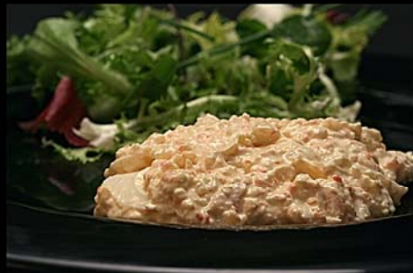
Ensalada Neptuno ▶