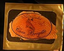
◀ Salmón ahumado Sobres de 100 gr.